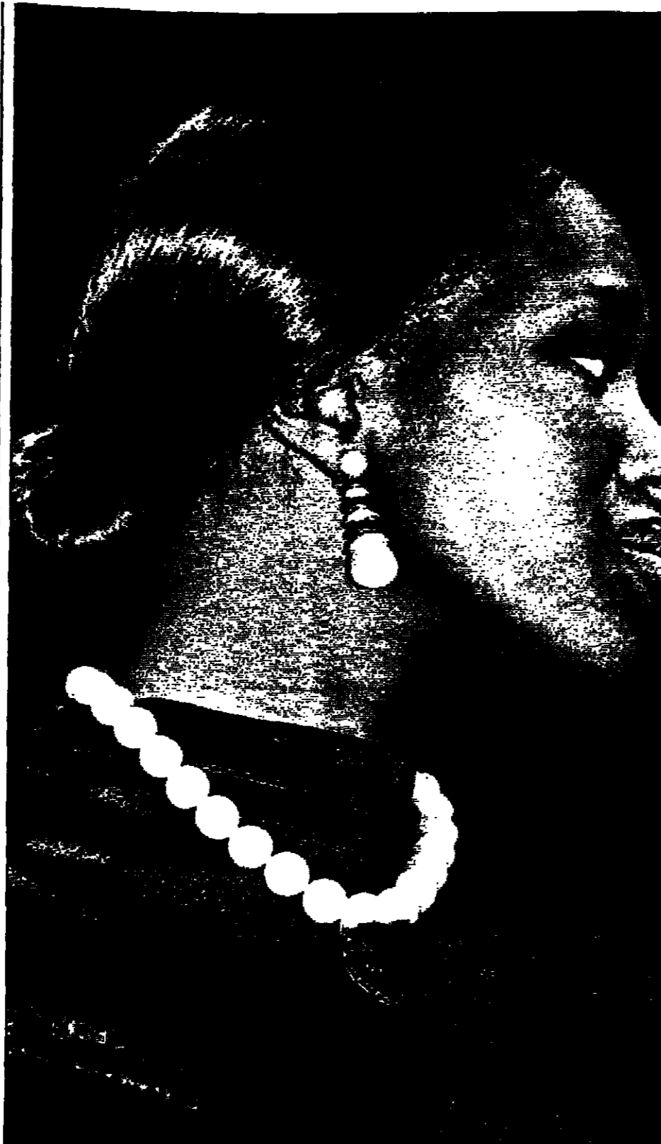
عرضة الأزياء البريطانية تعرضي كامل قمت سلفا جنيدا بتكون من عند خلق في السوق الدولية للمجوهرات للقائمة بابل (سويسرا)

كيب كانيال (فلوريدا)-رويترز: قال مسؤولون في ادارة الطيران والفضاء الامريكيا (ناسا) ان رواد فضاء الكوكب كولومبيا اصبحوا جاهزا للاعاشة كان لا تصيب به على متن الكوكب. وتم إصلاح جهاز الإعاشة المعطل على متن الكوكب كولومبيا في ساعة متأخرة من الليل الجمعة ما اضطر الطاقم الى تشغيل جهاز الإعاشة الاصطناعي والتهديد باختصار برنامج ابحاث الكوكب. وقال في بيروكي مدير عمليات الكوكب انه رغم عدم وجود خطر قوي على رواد كولومبيا الا ان عمليات تفتيحه التي تدرس